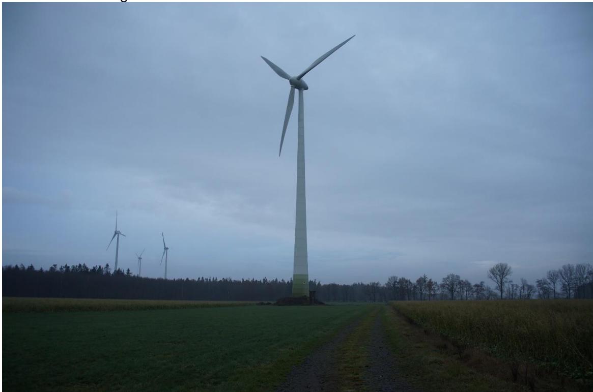
Abb.: Foto R1 (Dezember 2022)