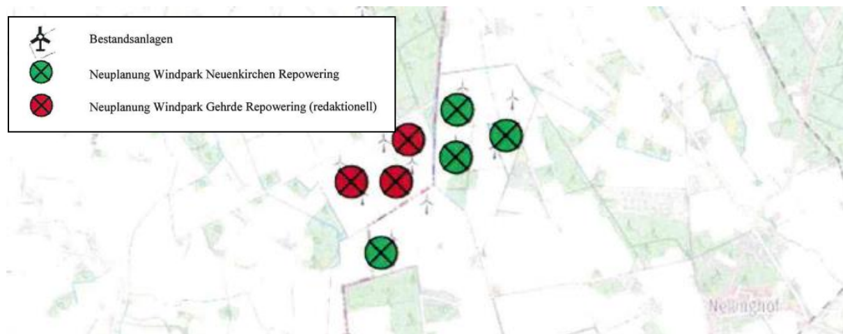
Abb.: Neuplanung Windpark Repowering (2022, Ausschnitt, o.M.)

Der bestehende Windpark soll nunmehr erneuert bzw. „repower“ werden. Das Repowering wird durch einen Vorhabenträger in Abstimmung mit den Grundstückseigentümern vorbereitet. Zielsetzung ist es, insbesondere das Planungsrecht mit der im Bebauungsplan festgeschriebenen Höhenbegrenzung sowie die festgelegten WEA-Standorte aufzuheben. Nach dem Abbau der sechs vorhandenen Bestandsanlagen (je ca. 1 MW) sollen vier moderne WEA (je ca. 4,2 MW) mit einer Gesamthöhe von bis zu 230 m errichtet werden.