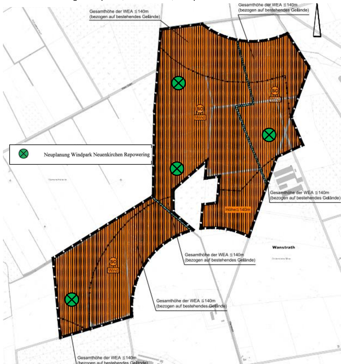
Abb.: 3. Änderung FNP (2016, Ausschnitt, o.M.)

Es wird darauf hingewiesen, dass außerhalb der in der 3. Änderung des Flächennutzungsplanes dargestellten Sondergebiete zur Steuerung der Zulässigkeit von privilegierten Windenergieanlagen (Teilbereich 1 = Windpark Nellinghof und Teilbereich 2 = Windpark Vörden) gemäß § 35 (3) Satz 3 BauGB im Geltungsbereich des Flächennutzungsplanes der Gemeinde Neuenkirchen-Vörden in der Regel keine weiteren Windenergieanlagen gemäß § 35 (1) Nr. 5 BauGB zulässig sind (s.g. „Ausschlusswirkung“ des § 35 Abs. 3 Satz 3 BauGB). Dies betrifft sowohl Windparks als auch Einzelanlagen.