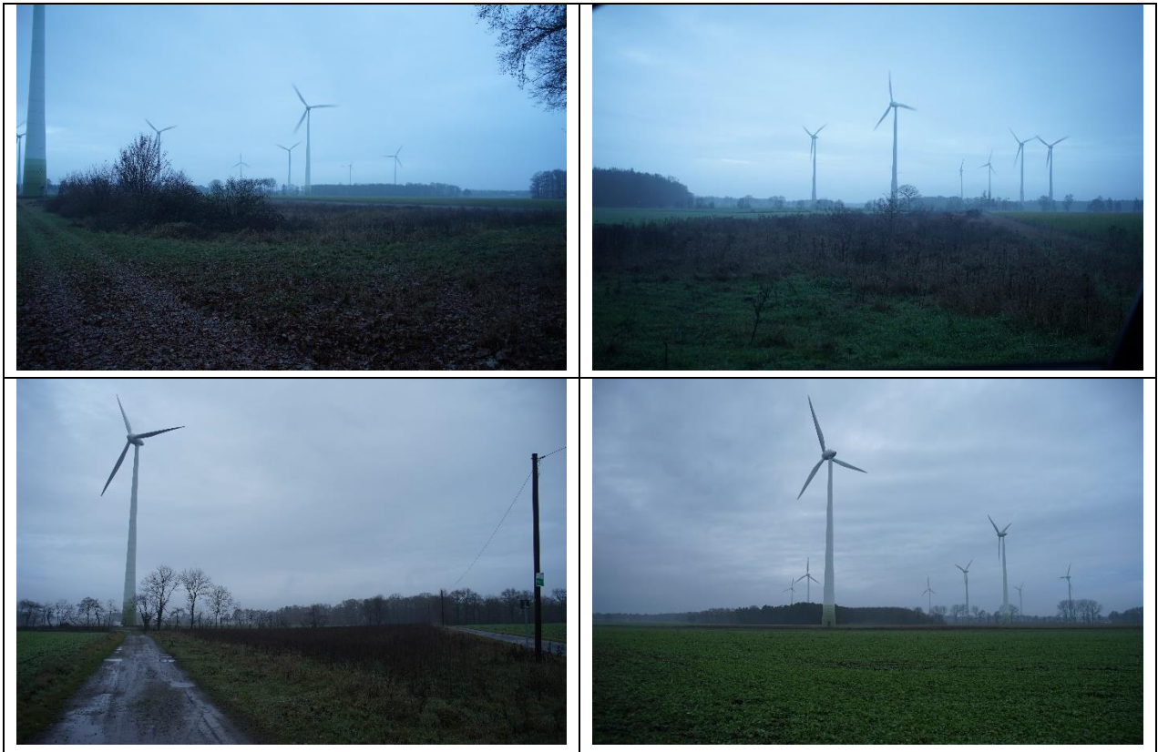
Abb.: Fotos Aufhebungsbereich / Flächen für die Entwicklung von Natur und Landschaft (Dezember 2022)

Im Rahmen einer vor-Ort-Begehung im Dezember 2022 zeigte sich, dass das Plangebiet weitestgehend intensiv landwirtschaftlich (Acker) genutzt wird. Bei den „Flächen für die Entwicklung von Natur und Landschaft“ (R2-R7) handelt es sich um halbruderale Gras- und Staudenfluren mit teils Strauch- und kleinen Gehölzaufwüchsen.